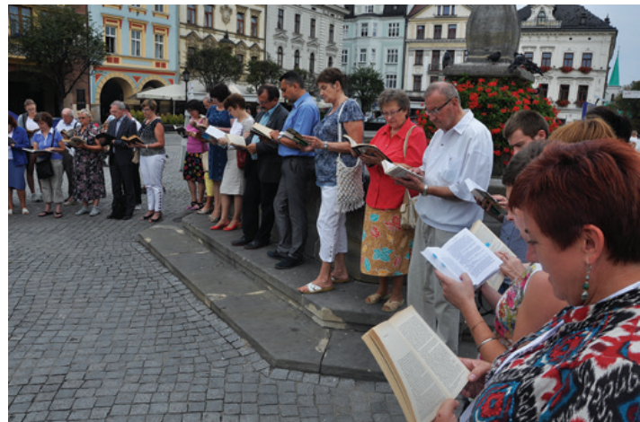
Chętnych do czytania było wielu...

Każdy kto w sobotę przyniósł egzemplarz Quo vadis , mógł otrzymać pamiątkową pieczęć pary prezydenckiej, poszukiwani byli tak-