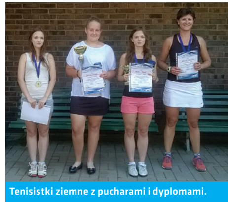
Tenisistki ziemne z pucharami i dyplomami.