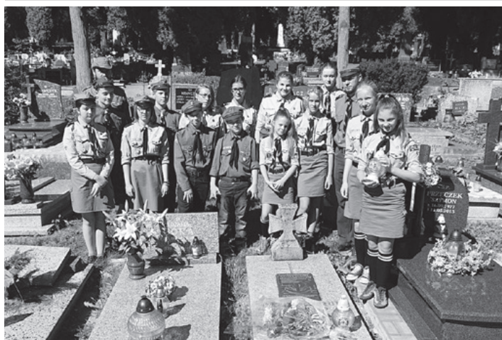
Harcerze na cmentarzu komunalnym.