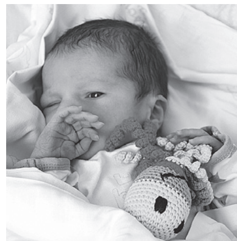
„Ośmiorniczki” podbijają polskie szpitale.

Przy wypisie ze szpitala mali pacjenci Szpitala Śląskiego dostają swoją ośmiorniczkę do domu. Każdego miesiąca potrzebnych jest coraz więcej maskotek, dlatego uczestnicy kampanii apelują o jej wsparcie.