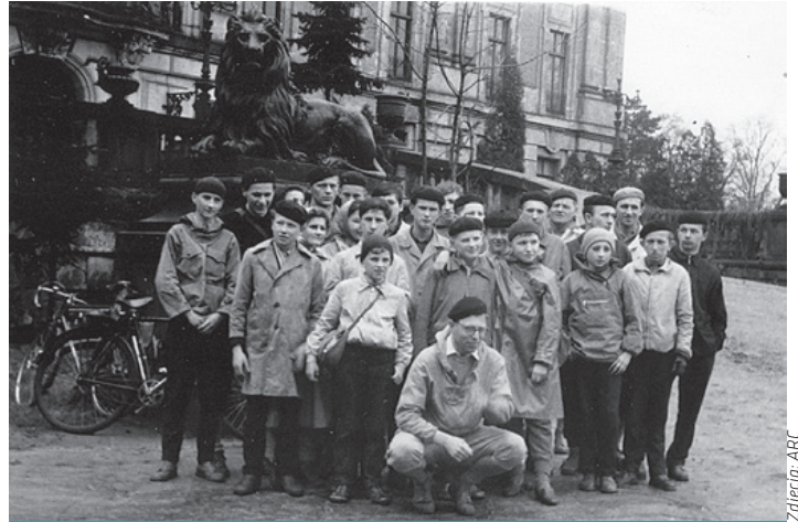
Cieszyńscy kolarze w Pszczynie, rok 1963.

Przy każdym większym zakładzie pracy istniały zadane wiaty wybudowane specjalnie dla przechowywania jednośladów. Wśród tych setek robotników dojeżdżających „do werku”, na kopalnię czy do mniejszej fabryczki, znaleźlibyśmy zapewne zapaleńców, którzy w dniach wolnych od pracy umawiali się na niedzielną wycieczkę. Że i takie wycieczki miały miejsce, wiem, gdyż sam brałem w nich udział, wożony przez ojca na bagażniku. Ale i te wycieczki nigdzie nie były notowane, gdyż był to daleki margines w codziennych troskach o byt niejednej rodziny.